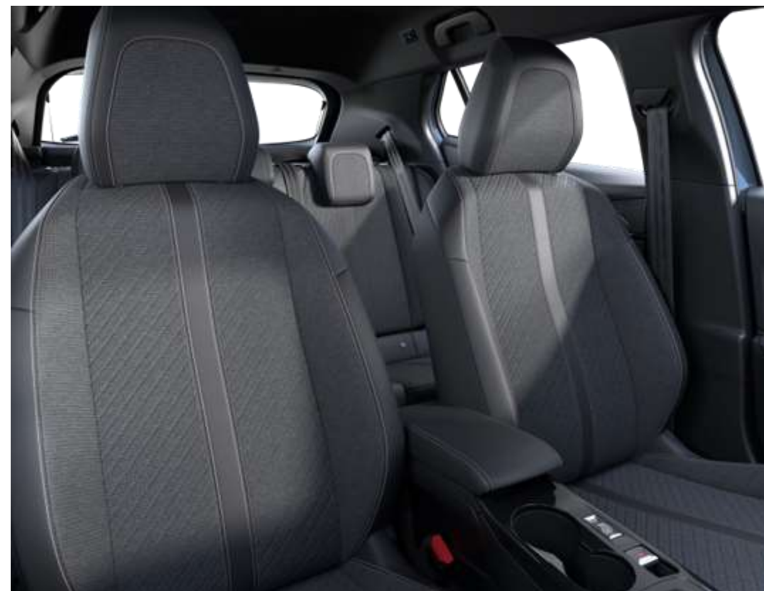
Stoffen bekleding CASUAL LOMSA met reliëf, afwerking in TEP, drievoudige LOMSA-materialen en stiksels Quartz