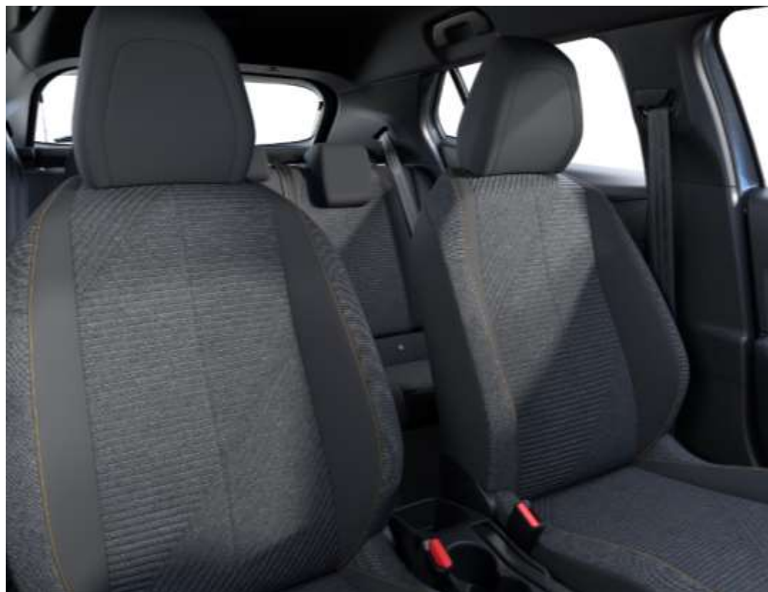
Stoffen bekleding RENZO, afwerking Rimini met stiksels Orange Sunrise