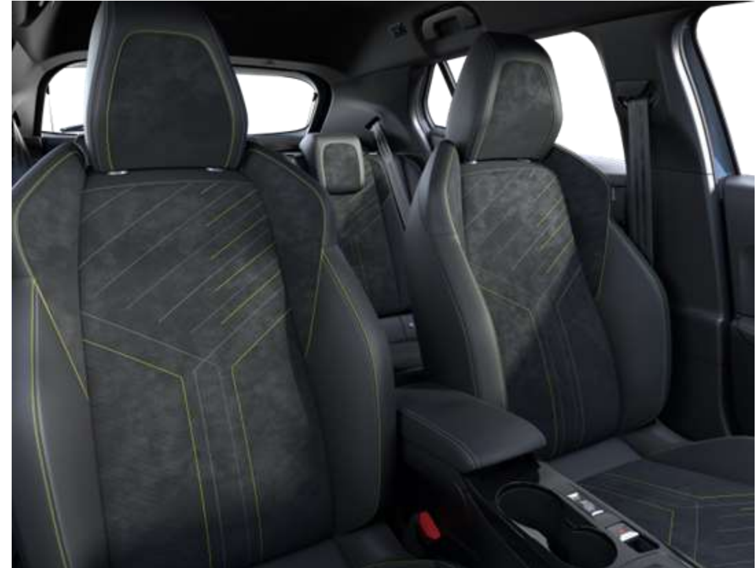
Sellerie Alcantara® Mistral ICONIUM accompagnement TEP Isabella, trimatière Alcantara Noir et surpiqûres Vert Adamite