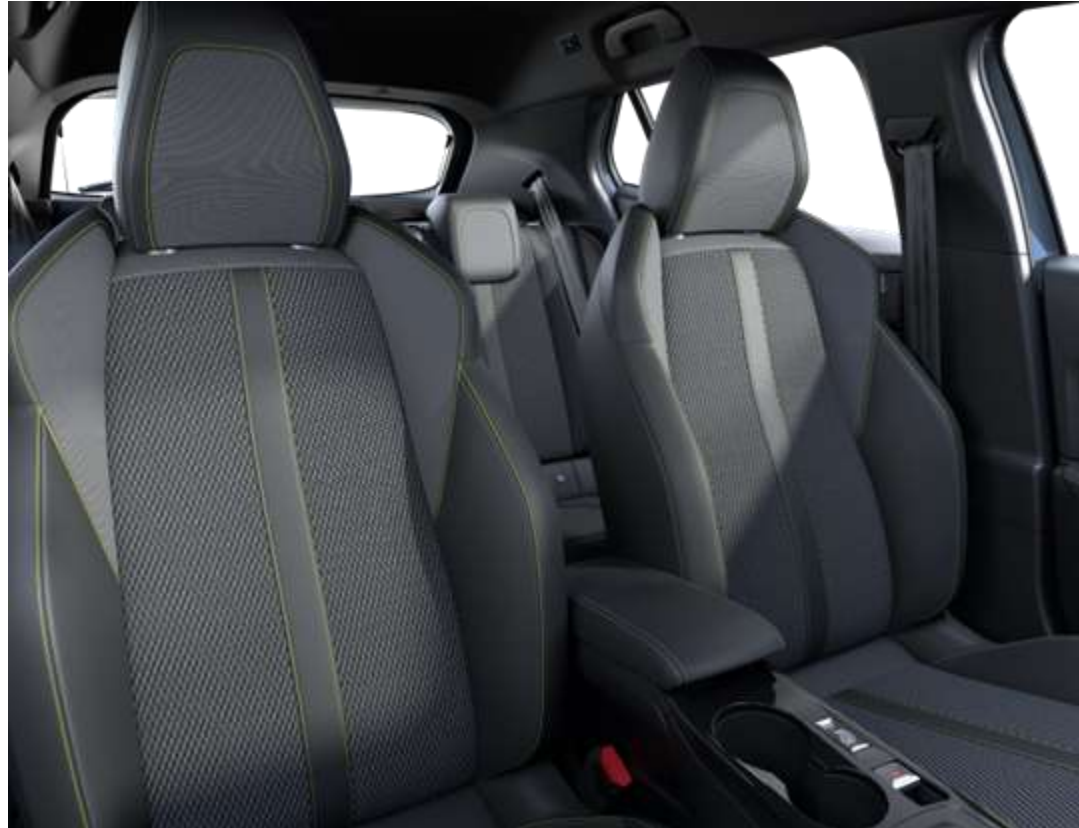
Sellerie tissu BELOMKA, accompagnement TEP Isabella, trimatière Uni Copy et surpiqûres Vert Adamite