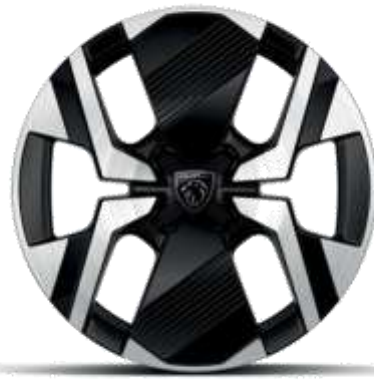
Jantes alliage 17" diamantées KARAKOY bi-tons Noir Onyx et vernis brillant

De série sur ALLURE, GT En option sur BUSINESS (Sauf si Pneumatiques All Seasons))