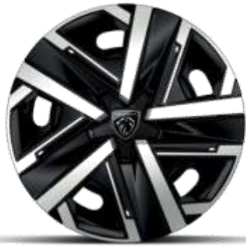
Jantes tôle 16" avec enjoliveurs SILOM Gris Eclat & Noir Orbitat, vernis mat