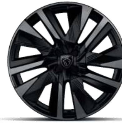
Jantes alliage 18" diamantées EVISSA bi-tons Noir Onyx, vernis Black Mist avec inserts Noir Onyx mat

De série sur ALLURE, GT En option sur BUSINESS (Sauf si Pneumatiques All Seasons))